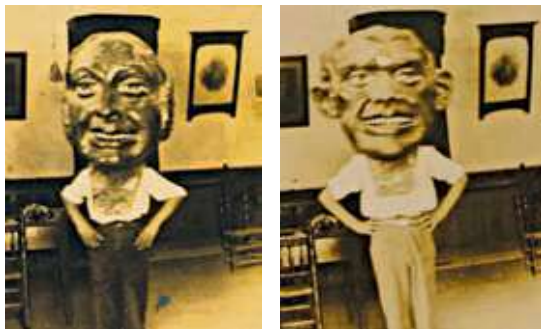
Imatge dels dos nans antics

nàrguens tenia durant el segle XX dos capgrossos que van sortir per darrer cop pels vols de l'any 1980 i que van quedar destruïts a causa d'una ri-